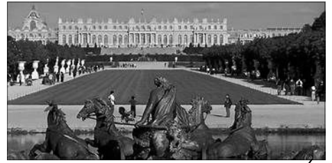
Le bassin d'Apollon, dieu grec du soleil sur son char.